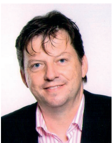
Markus Oppel, Senior Scientist an der Universität Wien.

ler vorzustellen sowie Ideen auszutauschen und neue Interaktionen zu begründen. Insbesondere sollen junge Nachwuchswissenschaftler einbezogen werden.